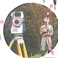
リモートキャッチャー RC-PR3 または RC-PR4